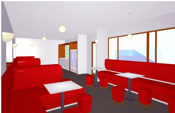
Visualisierung Café im Zwischengeschoß