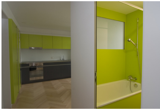
Sanitärbox und Wohnküche