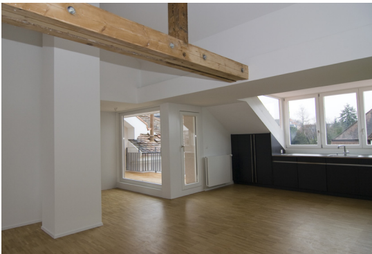
Wohnküche im Dachgeschoss