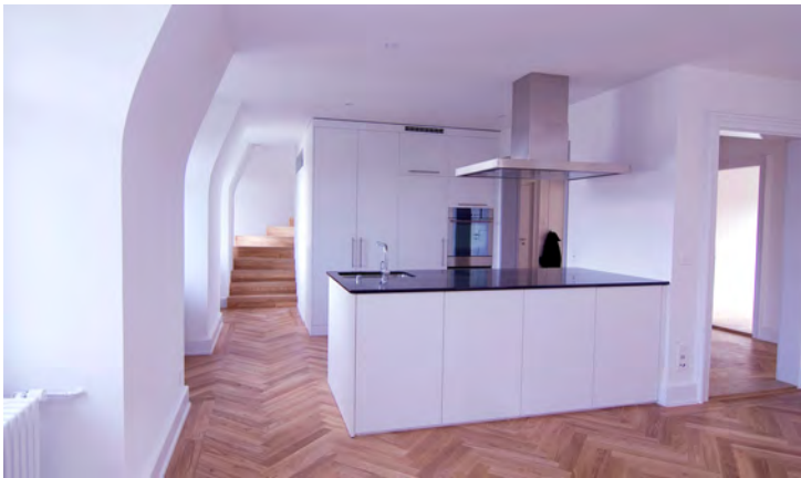
Küche und Treppe zum Dachgeschoss