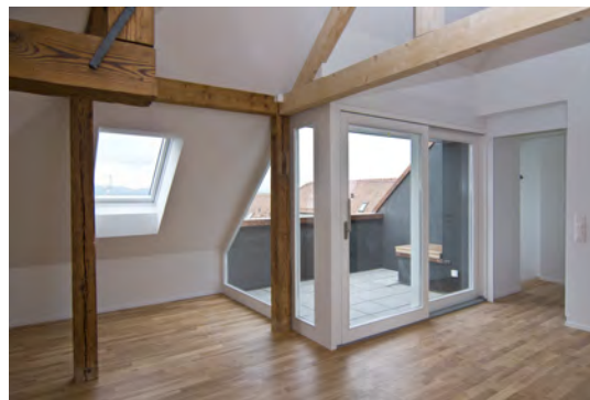
Dachgeschossausbau mit Terrasse