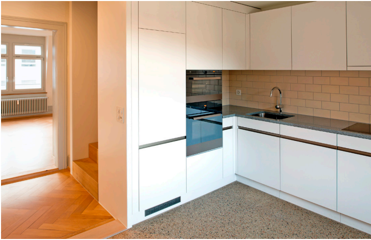
Neue Küche mit interner Treppe der Maisonette-Wohnung