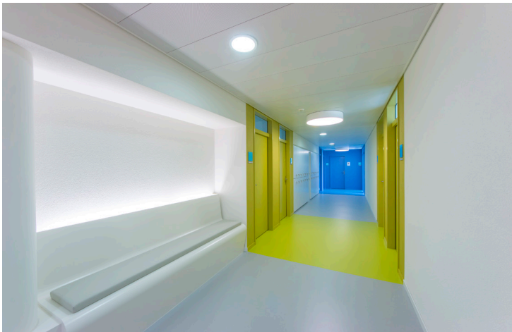
Korridor mit Wartebank

Von Ateliers und Werkstätten der Tagesklinik mit Bewegungs-, Ruhe- und Gesprächsräumen über Therapiezimmer, Serviceräume und Administration spannt sich das komplexe Raumprogramm bis hin zu Apotheke und Küchen. Dabei galt es hohe Anforderungen an den Schallschutz (vertrauliche Therapiegespräche), die Sicherheit (kontrollierte Methadonabgabe, Suizidschutz) und das Klima (Medikamentenlagerung) zu berücksichtigen.