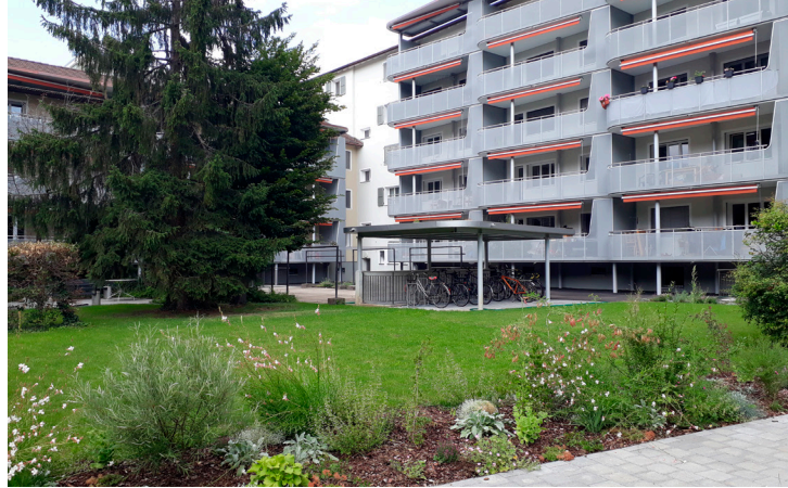
Gartenanlage im Hof mit Baumbestand