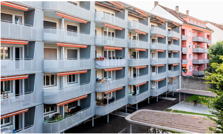
Wellenförmige Bewegung im Gesamtbild