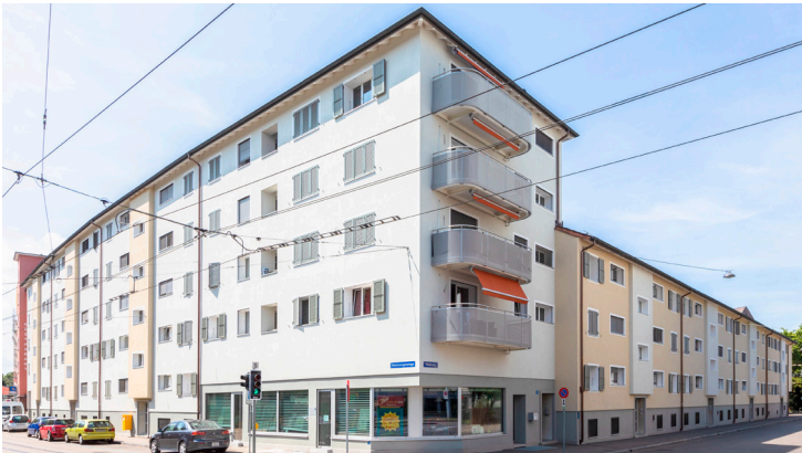
Strassenseitige Balkone mit Farbkonzept