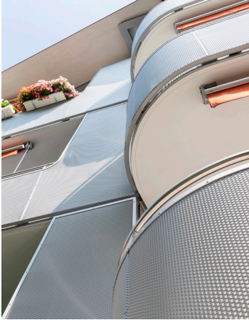
Materialisierung in Streckmetall